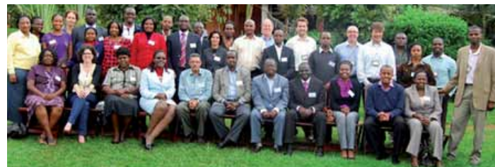
Formazione Travelife per partner principianti in Kenya

Travelife offre gli strumenti per coinvolgere e valutare i vostri partner commerciali internazionali. I vostri partner possono usufruire della stessa formazione e dello stesso programma di rendicontazione per raggiungere i livelli Travelife Partner o Travelife Certified. I partner possono inoltre prendere parte ai programmi di formazione Travelife nelle destinazioni, programmi che sono già stati organizzati in più di 25 paesi.